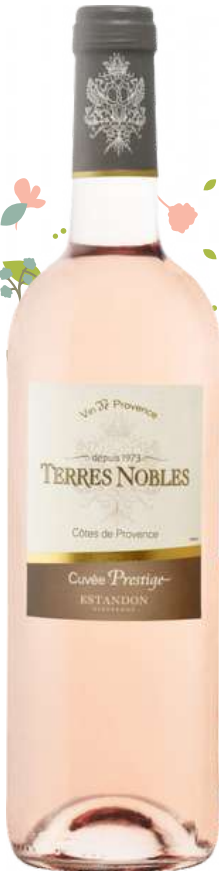
CÔTES DE PROVENCE Terres Nobles 2020

x6 Prix public : 10,00€ TTC Tarif La Cave des CE : 6,00€ TTC la bouteille