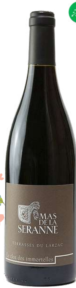
TERRASSES DU LARZAC Clos Les Immortelles Mas de La Seranne

2020 X1 Prix public : 90,00€ TTC Tarif La Cave des CE : 65,00€ TTC la bouteille