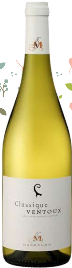
VENTOUX Blanc "Classic" Maison Marrenon 2023

x6 Prix public : 10,00€ TTC Tarif La Cave des CE : 6,00€ TTC la bouteille