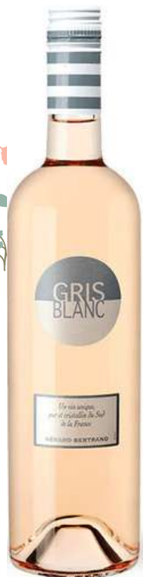
LANGUEDOC Gris blanc Domaine Gérard Bertrand ■ 2023

x6 Prix public : 10,00€ TTC Tarif La Cave des CE : 8,50€ TTC la bouteille