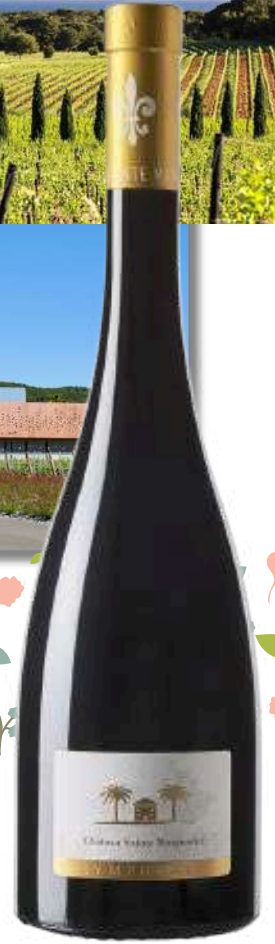
CÔTES DE PROVENCE Fantastique Château Sainte-Marguerite

2022 X6 Prix public : 22,00€ TTC Tarif La Cave des CE : 18,00€ TTC la bouteille