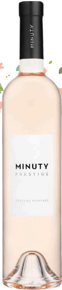
CÔTES DE PROVENCE Minuty Prestige 2023

x6 Prix public : 20,00€ TTC Tarif La Cave des CE : 14,50€ TTC la bouteille