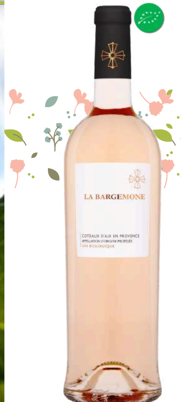
CÔTEAUX D'AIX en PROVENCE La Bargemone ■ 2022/23

x6 Prix public : 12,00€ TTC Tarif La Cave des CE : 10,00€ TTC la bouteille