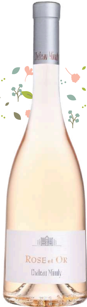
CÔTES DE PROVENCE Cuvée Rose & Or Château Minuty 2023/24

x6 Prix public : 20,00€ TTC Tarif La Cave des CE : 17,50€ TTC la bouteille