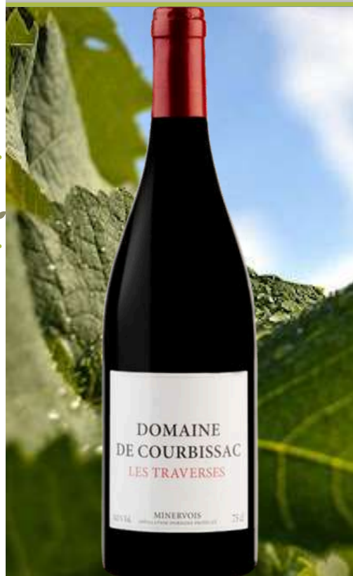
MINERVOIS "Les Traverses" Domaine de Courbissac ■ 2019

x6 Prix public : 10,00€ TTC Tarif La Cave des CE : 8,50€ TTC la bouteille