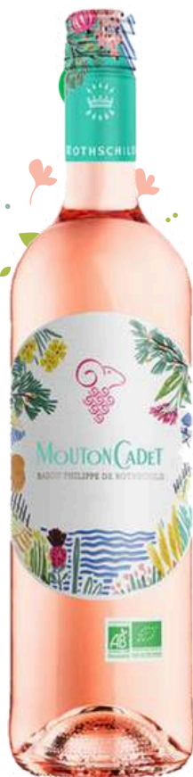
BORDEAUX Mouton Cadet 2022

x6 Prix public : 8,00€ TTC Tarif La Cave des CE : 4,95€ TTC la bouteille