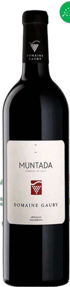
IGP CÔTES CATALANES Muntada Domaine Gauby

2020 X1 Prix public : 90,00€ TTC Tarif La Cave des CE : 65,00€ TTC la bouteille