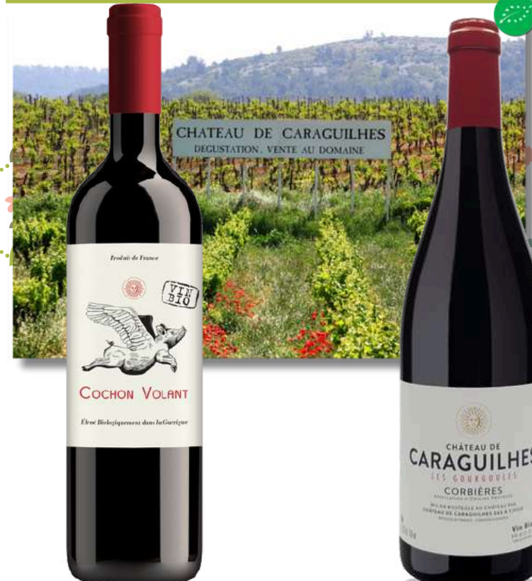
CORBIÈRES Cochon Volant ■ 2023

x6 Prix public : 9,50€ TTC Tarif La Cave des CE : 6,50€ TTC la bouteille