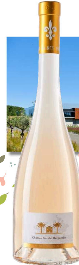
CÔTES DE PROVENCE Symphonie Château Sainte-Marguerite

2022 X6 Prix public : 22,00€ TTC Tarif La Cave des CE : 18,00€ TTC la bouteille