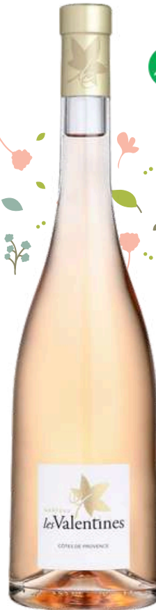
CÔTES DE PROVENCE LA LONDE Château Les Valentines 2022

x6 Prix public : 14,00€ TTC Tarif La Cave des CE : 8,95€ TTC la bouteille