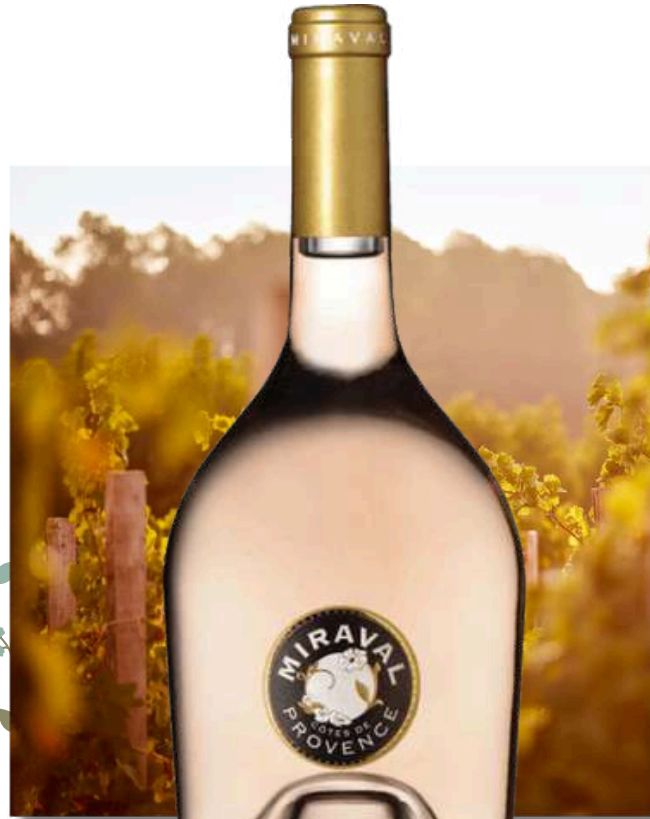
CÔTES DE PROVENCE Château Miraval

2020 X6 Prix public : 19,00€ TTC Tarif La Cave des CE : 17,00€ TTC la bouteille