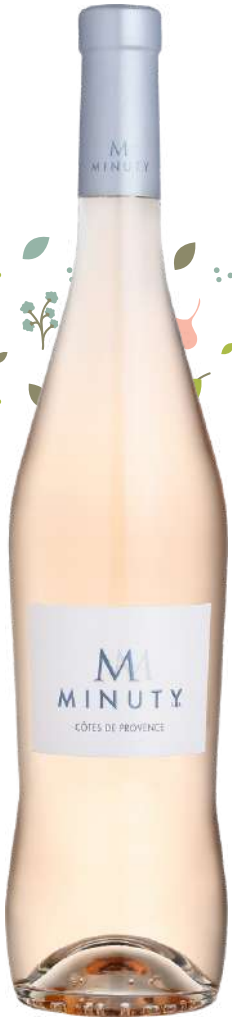
CÔTES DE PROVENCE M de Minuty 2024

x6 Prix public : 20,00€ TTC Tarif La Cave des CE : 14,50€ TTC la bouteille